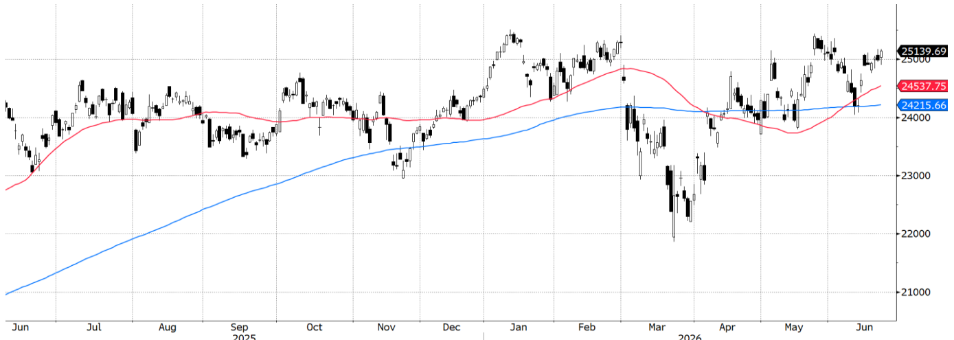
DAX Index (Deutsche Boerse AG German Stock Index DAX) graph 1550 Daily 09JUN2025-23JUN2026