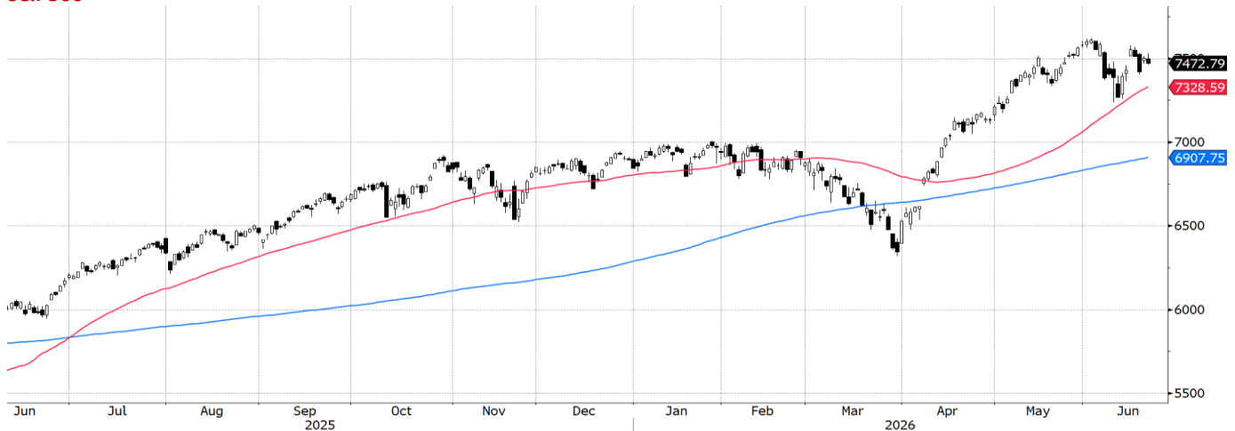
SPX Index (S&amp;P 500 INDEX) graph 1550 Daily 09JUN2025-23JUN2026