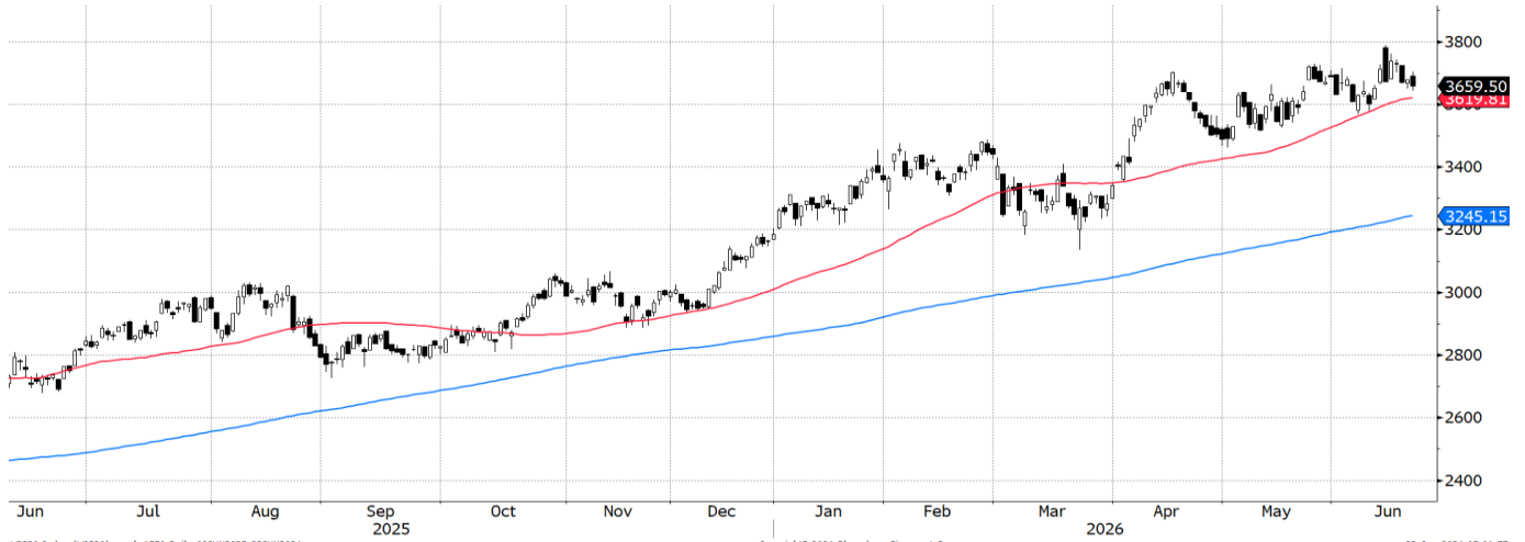
WIG20 Index (WIG20) graph 1550 Daily 09JUN2025-23JUN2026