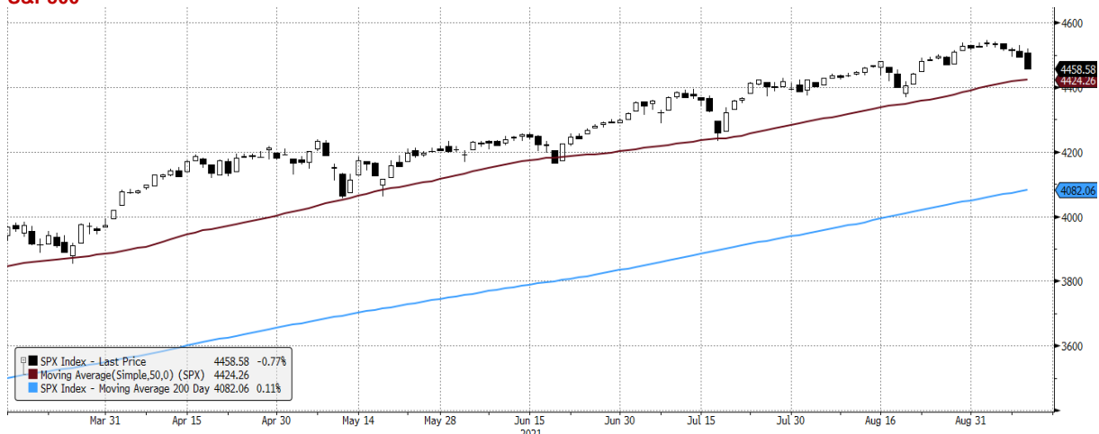
SPX Index (S&P 500 INDEX) G1598 Daily 13MAR2021-13SEP2021