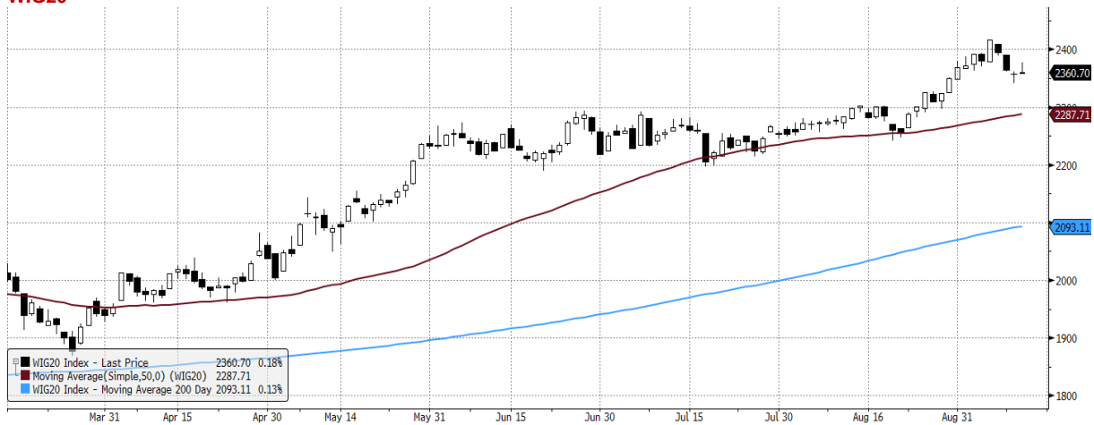
WIG20 Index (WIG20) graph 1550 Daily 13MAR2021-13SEP2021