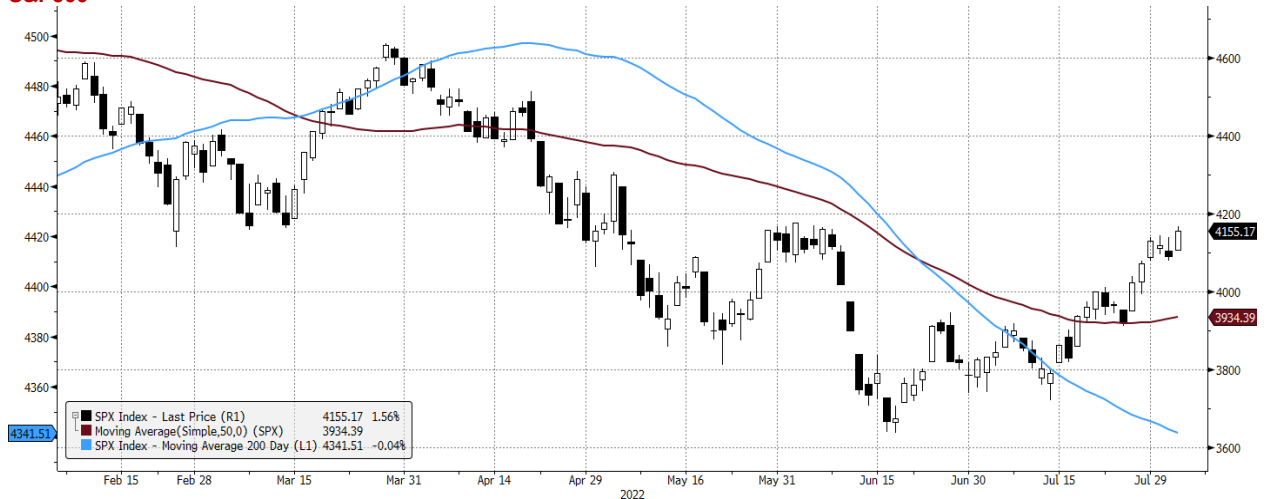
SPX Index (S&P 500 INDEX) G1598 Daily 04FEB2022-04AUG2022