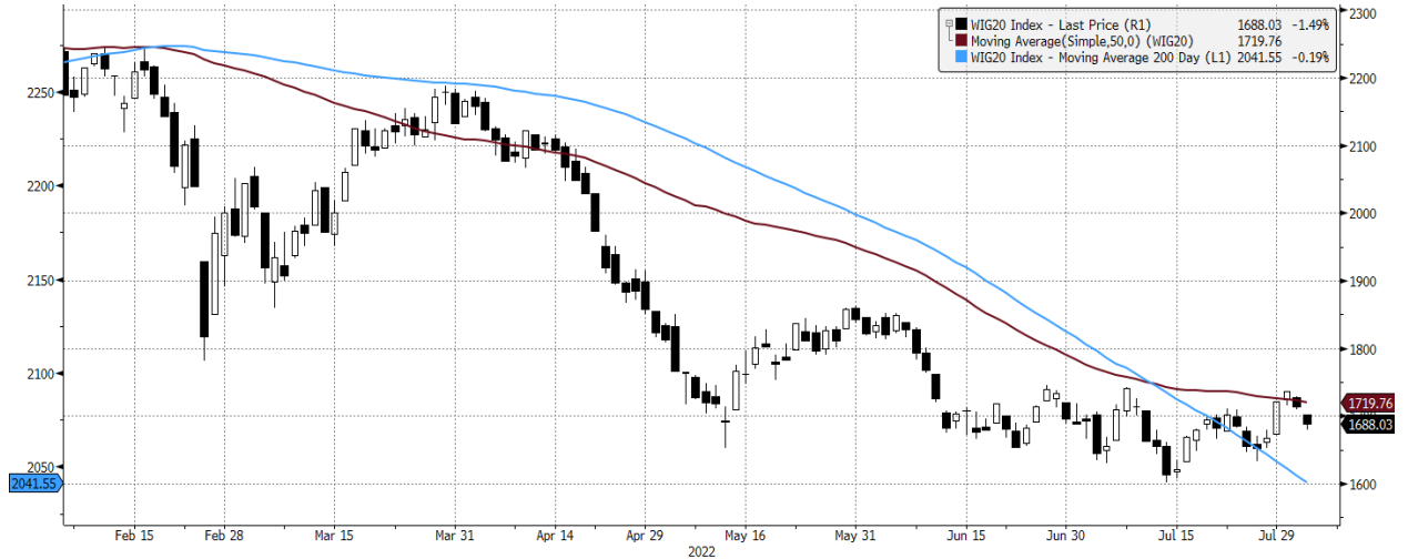
WIG20 Index (WIG20) graph 1550 Daily 04FEB2022-04AUG2022