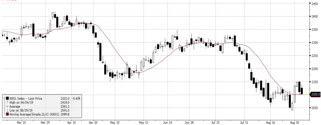
KRS1 Index (VSE WIG20 Index Future) graph 1550 Daily 05MAR2019-05SEP2019