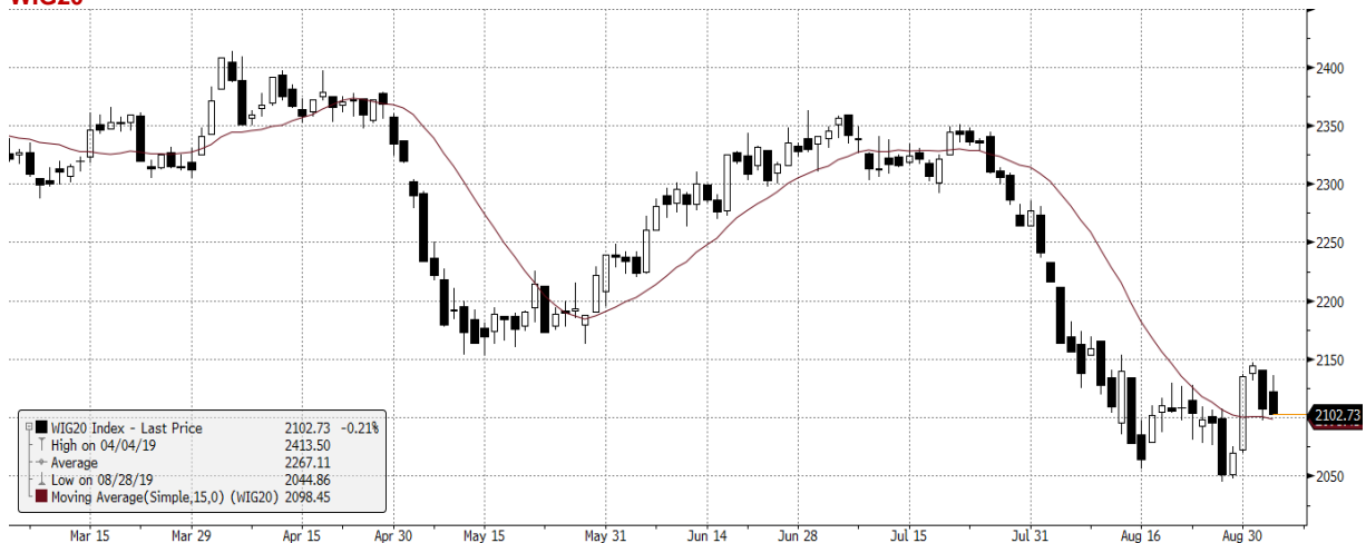
WIG20 Index (WIG20) G1598 Daily 05MAR2019-05SEP2019