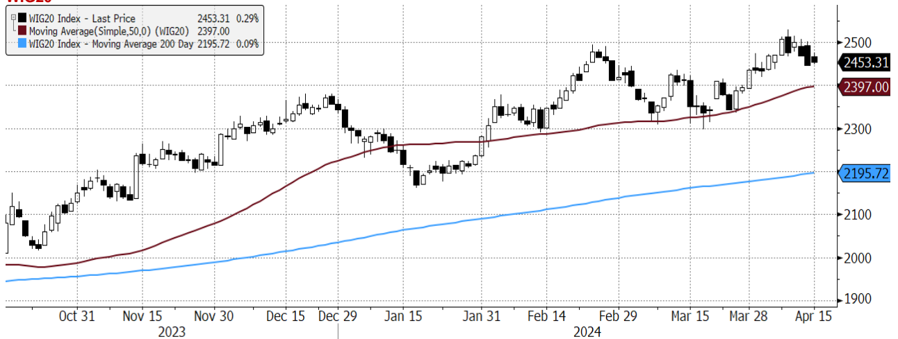
WIG20 Index (WIG20) graph 1550 Daily 16OCT2023-16APR2024